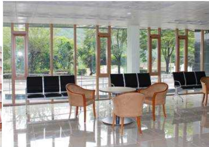
기숙사 1층 로비