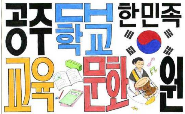
한글 스케치 대회