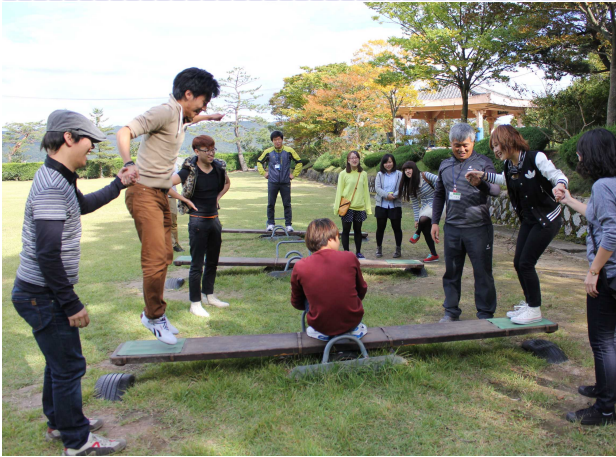
경주 화랑교육원 현장학습