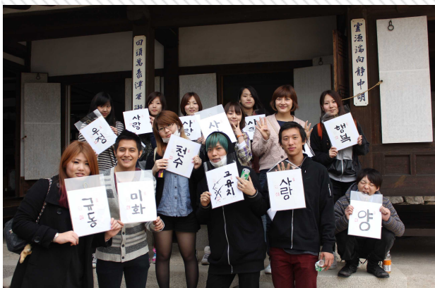
서울 남산골 한옥마을 현장학습