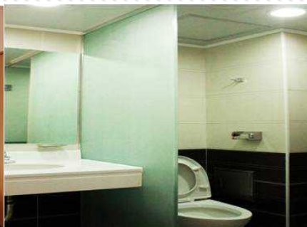
기숙사 생활실 욕실