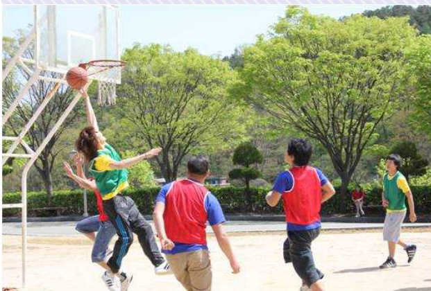
남자 농구 경기