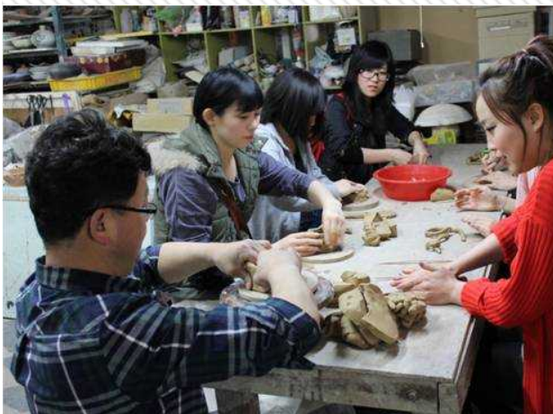
도자기 만들기 체험학습