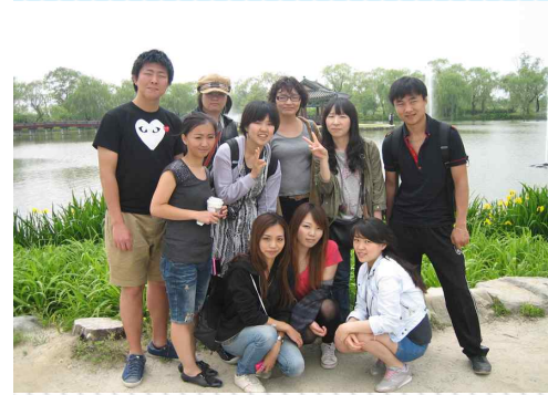
부여 백제문화 견학